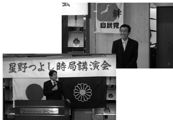
写真は昨年の時局講演会の模様 (講師安倍晋三元総理)

※このパーティは、政治資金規正法第8条2に規定する政治資金パーティです。 ※政治情勢の動向により、会の開催を延期する場合がありますを予めご了承ください。