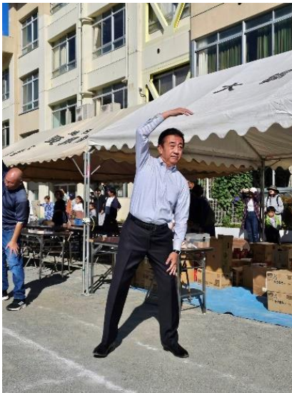
↑地元藤沢にて、秋晴れの空のもと各地区でレクリエーション大会が開催され朝のラジオ体操にも参加しました。