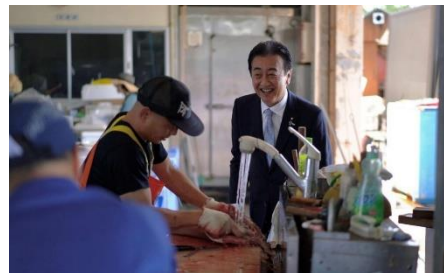
↑地元藤沢市片瀬の漁港で行われたフィッシャーズマルシェにお邪魔しました。