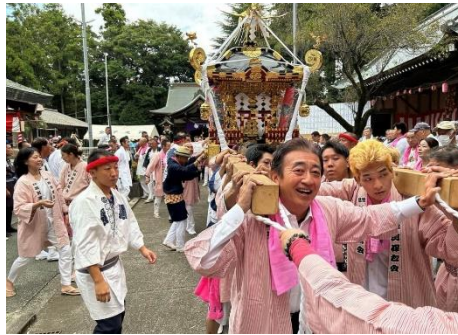
↑今年はコロナが5類となったこともあり4年ぶりに地域のお祭りが通常通り行われ、楽しく参加してきました。