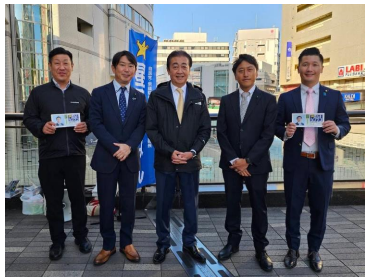
↑ 藤沢駅にて自民党藤沢市連合支部主催の街頭演説会を開催いたしました。毎月の恒例となっておりましたので、引き続き来年も行わせて頂きたいと思っております。