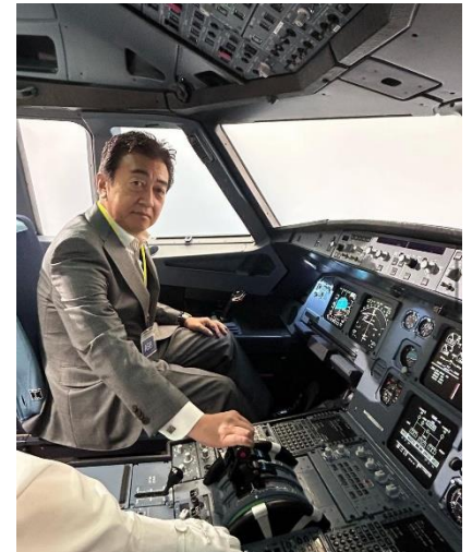
ANAのBlue Base(訓練センター)を視察させて頂きました。