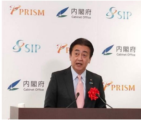
←SIP(戦略的イノベーション創造プログラム) PRISM(官民研究開発投資拡大プログラム)シンポジウム 2022 内閣府副大臣としてご挨拶しました。