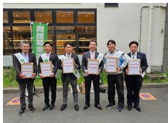
自民党藤沢市連合支部

自民党藤沢市連合支部と自民党寒川町連合支部による台湾東部地震の募金活動を実施させて頂きました。藤沢市、寒川町合わせて、合計金額は 84,276 円 です。大変多くの方々にご協力頂き、心より感謝申し上げます。お亡くなりになられた方々にお悔みを申し上げますと共に被災された皆様にお見舞い申し上げます。そして、一刻も早い復興を心より願っております。