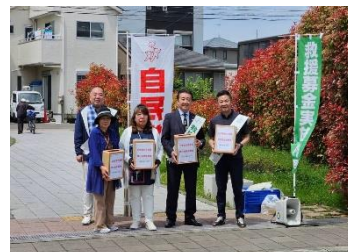
自民党寒川町連合支部